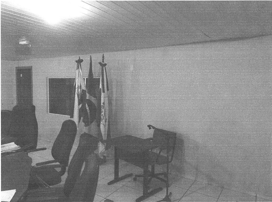
Imagem 7 – Pintura e textura