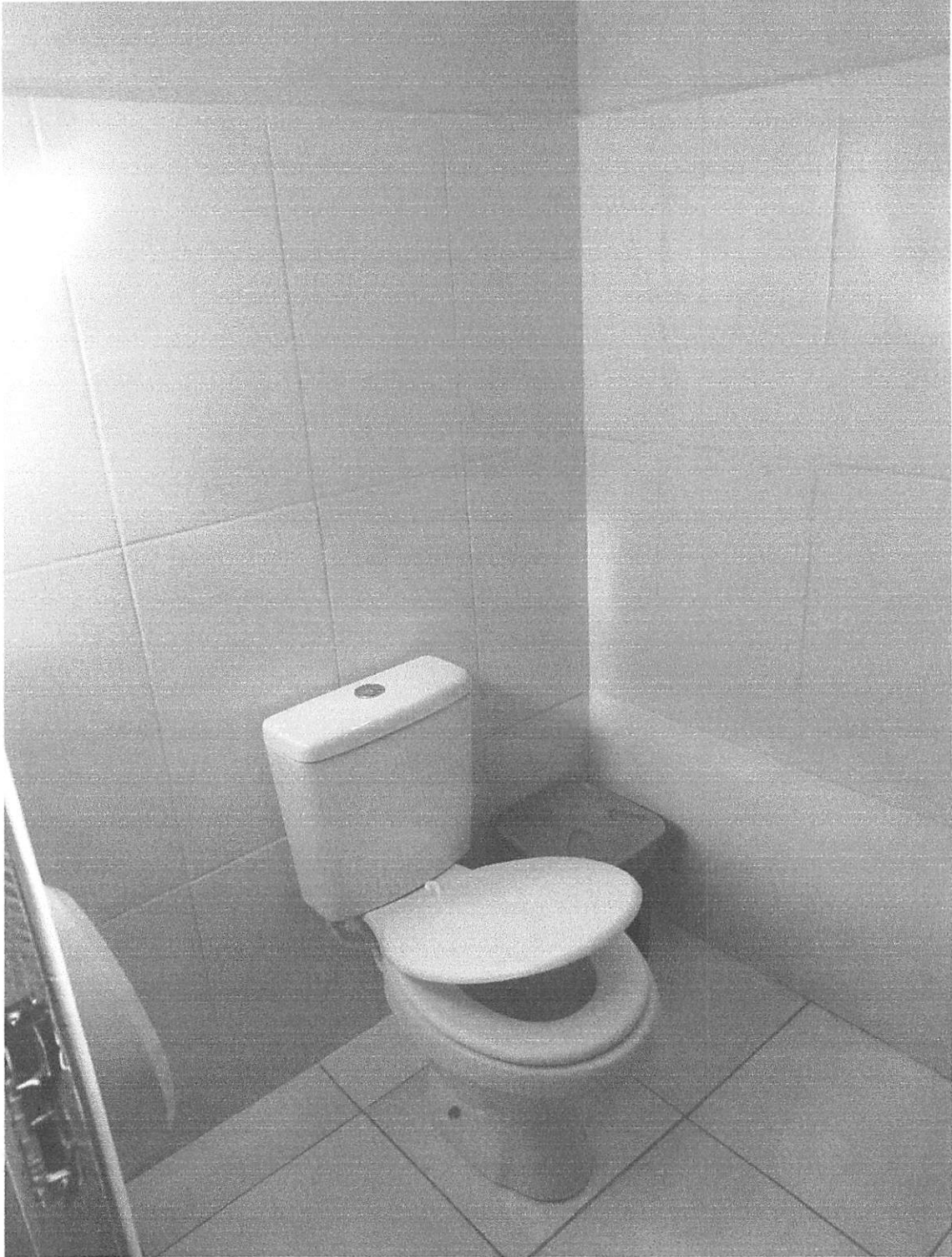
Imagem 2 – Revestimento cerâmico, piso, vaso acoplado, papeleira