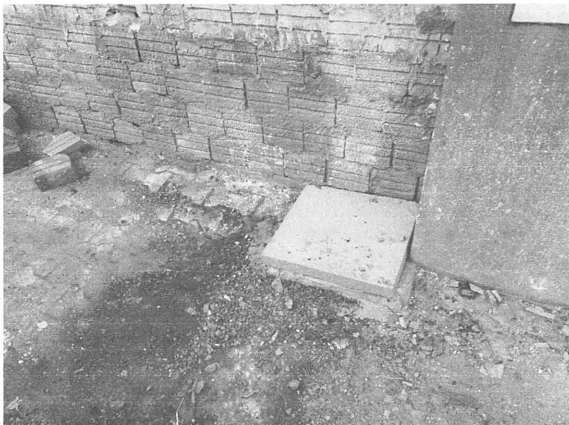
Imagem 5 – Caixa de passagem elétrica