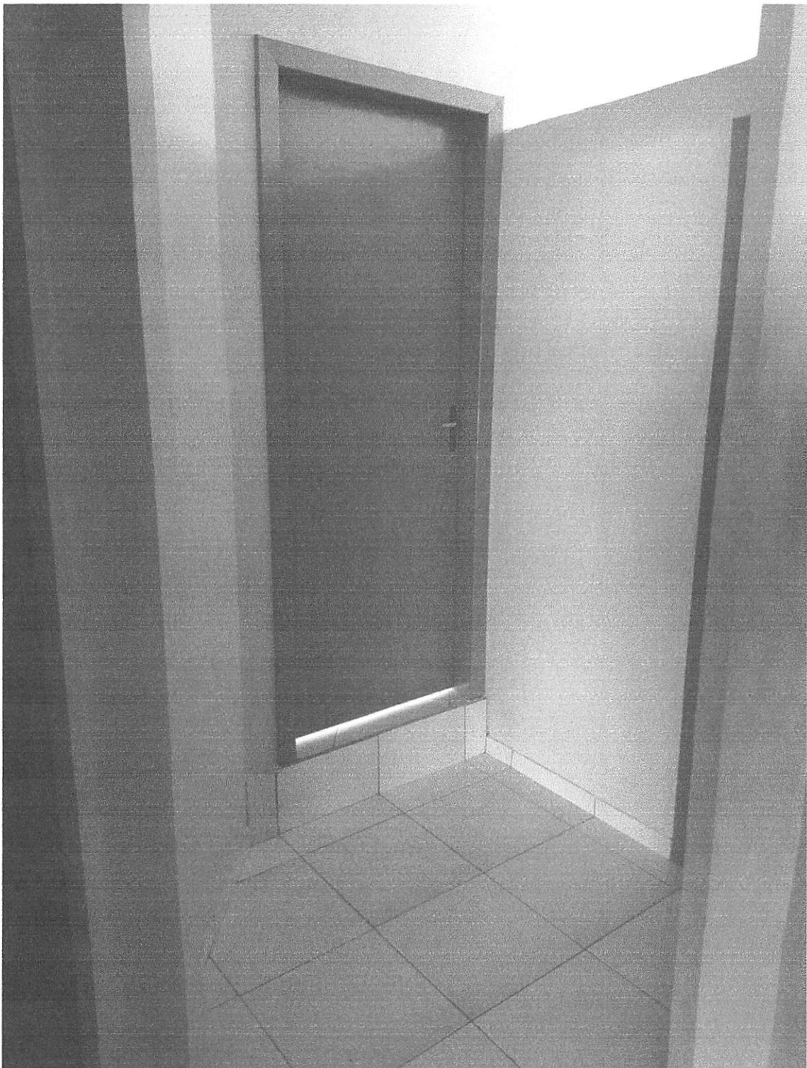
Imagem 4 – Porta, fechadura, piso cerâmico