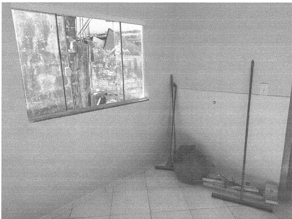
Imagem 6 – Janela, revestimento tanque, piso cerâmico