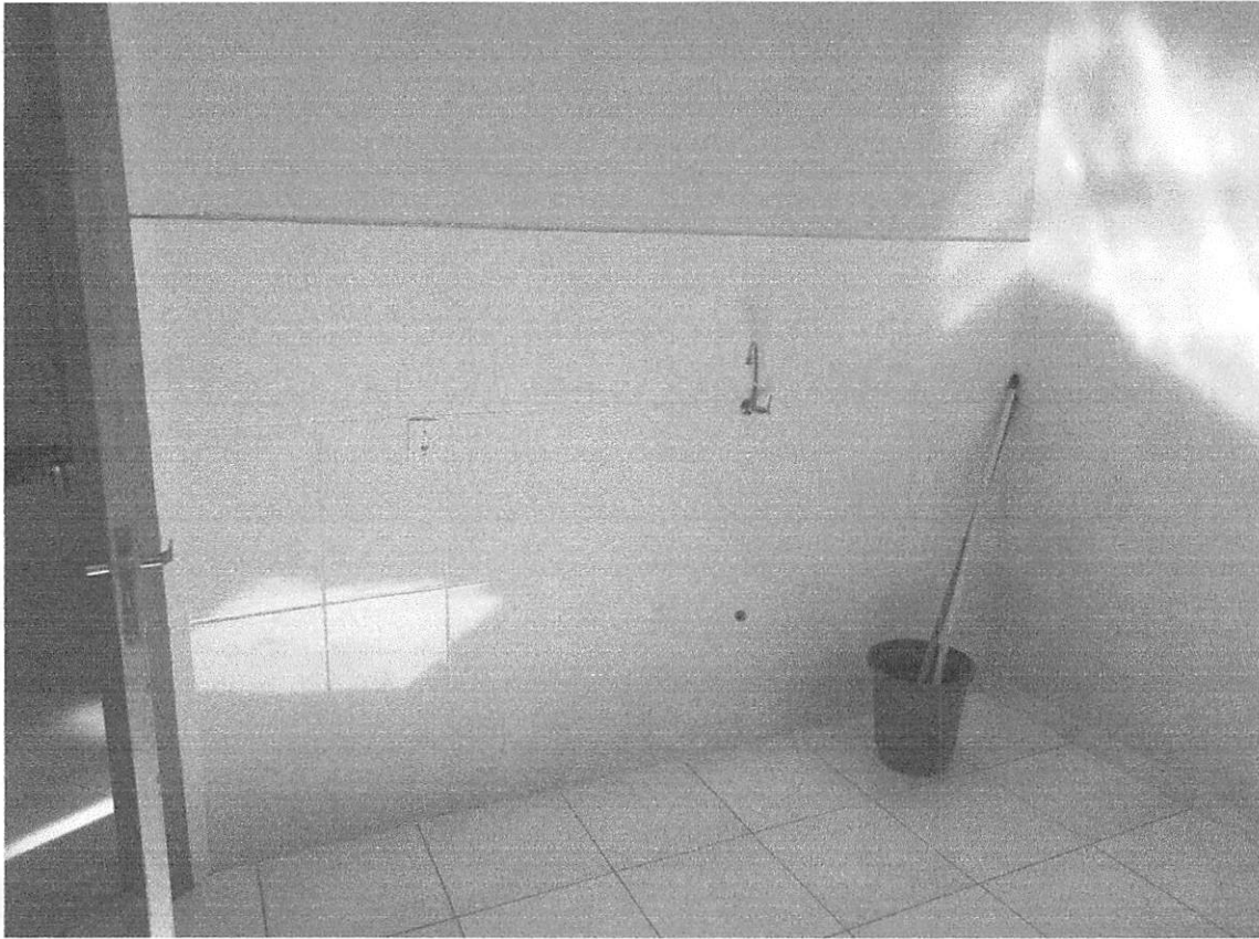
Imagem 1 – revestimento cerâmico, torneira, piso cerâmico