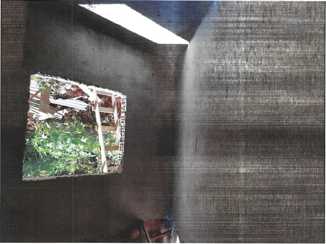
Imagem 1 – reboco externo