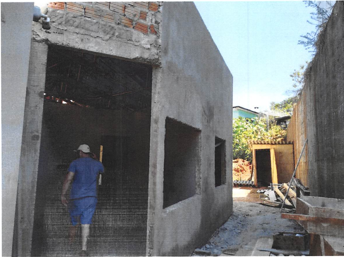
Imagem 5 – Reboco Externo