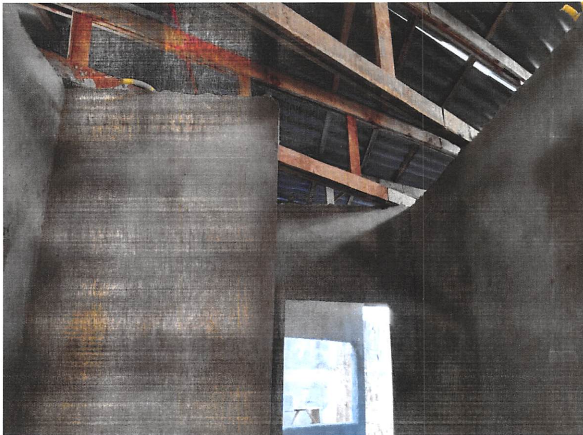
Imagem 6 – Reboco interno, estrutura de madeira e cobertura de fibrocimento