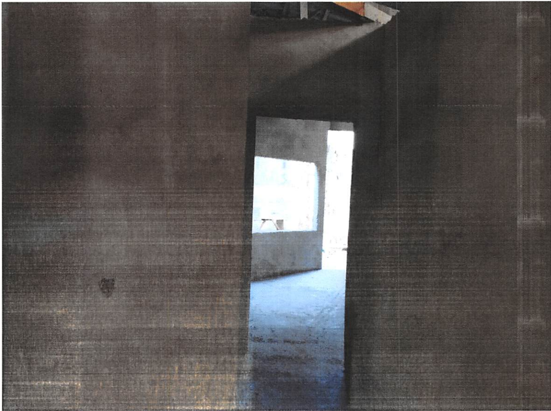
Imagem 7 – reboco interno e piso

Clyseverton Marcolina Engenheiro Civil CREA-PR 100672/D