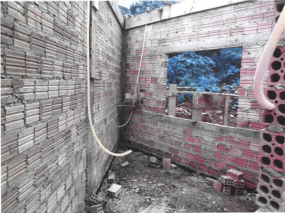
Imagem 2 – Alvenaria, fundação, impermeabilização, verga e contraverga, estruturas e vigas;