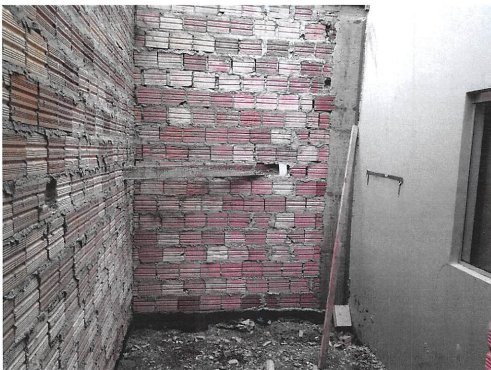
Imagem 3 – Alvenaria, pilar, baldrame