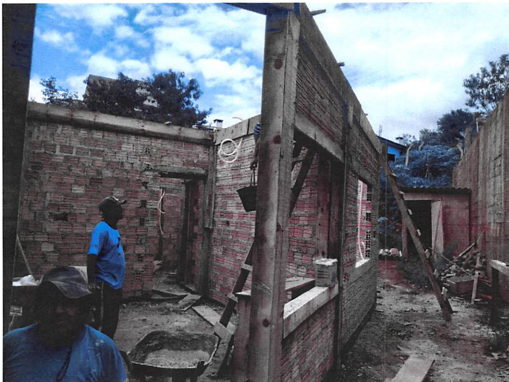
Imagem 2 – Alvenaria, fundação, impermeabilização, verga e contraverga, estruturas e vigas;