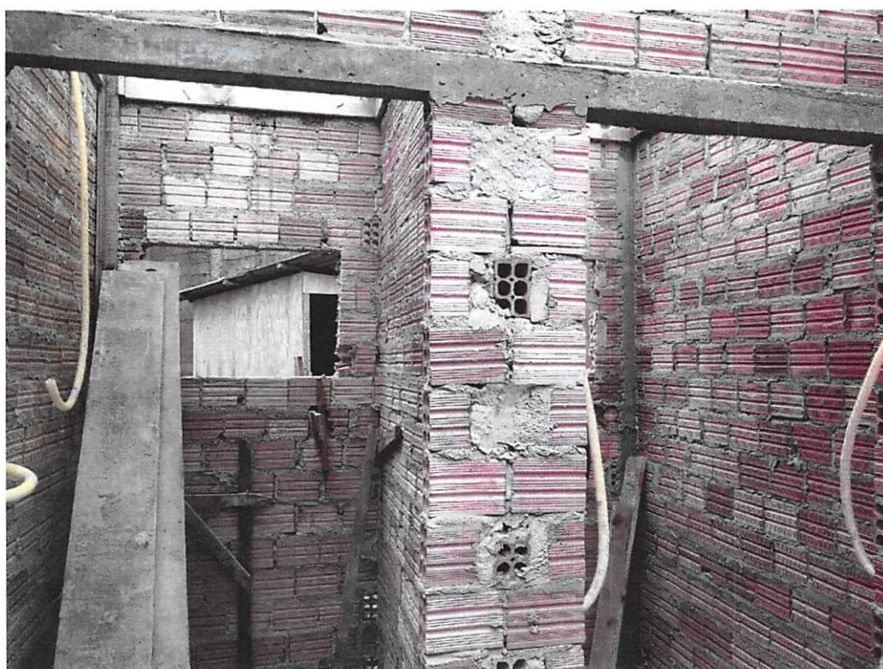
Imagem 4 – Alvenaria, verga

CLYSEVERTON MARGOLINA Engenheiro Civil CREA-PR 105672/D