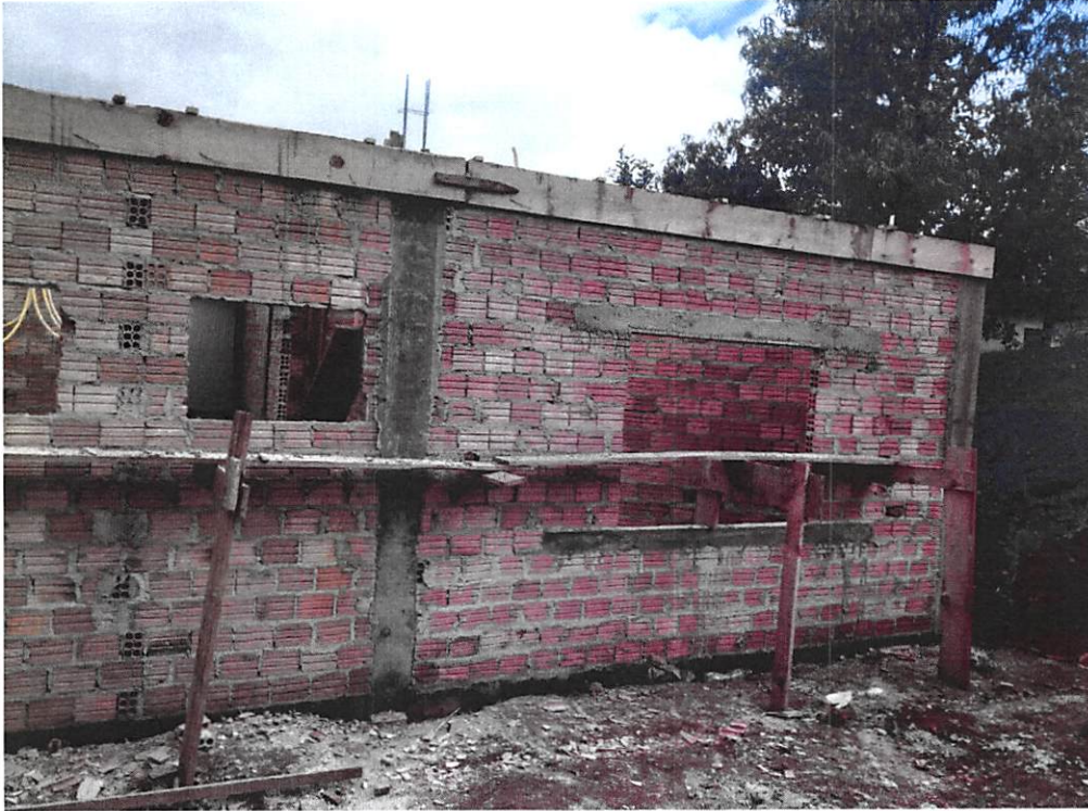
Imagem 1 – Alvenaria, fundação, impermeabilização, verga e contraverga, estruturas e vigas;